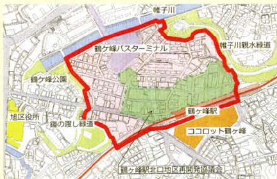
まちづくり構想区域: 太赤線で囲まれた区域

そこで、鶴ヶ峰駅北口の整備エリアを帷子川と親水公園、相鉄線に囲まれた区域(約8ヘクタール)に拡大し、平成30年度末までに鶴ヶ峰駅北口周辺地区のまちづくり構想を策定していく予定です。