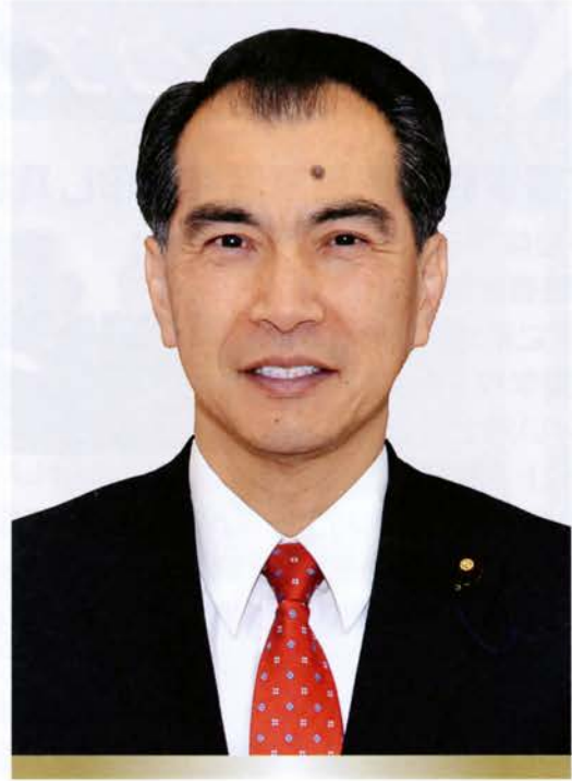
公明党横浜市議員団政務調査会 旭代表 横浜市議員