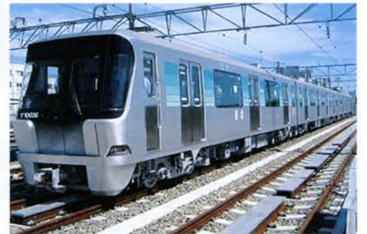
横浜市営地下鉄グリーンライン

たものです。相談役には上田勇衆議院議員・福田峰之衆議院議員が就いています。 平成25年3月22日に横浜環状鉄道の延伸実現を目指すため、旭区・緑区の公明党・自民党の横浜市会議員・神奈川県議員8人で結成され